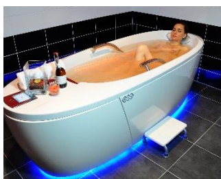
Nejstarší konopné lázně na jihu Čech