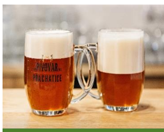
Hořkost je typickým znakem místních piv