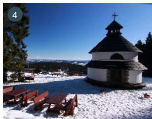
Lyžovačka u Klostermanna