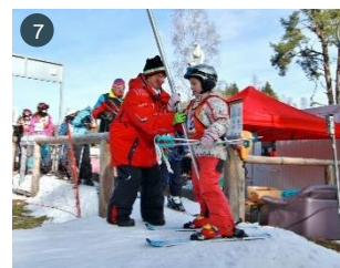
Rodinný areál pro všechny