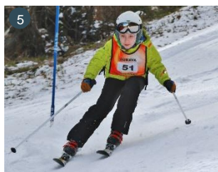
Lyžovačka nad Prachaticemi