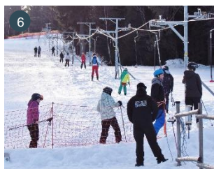
Sjezdování u hranic